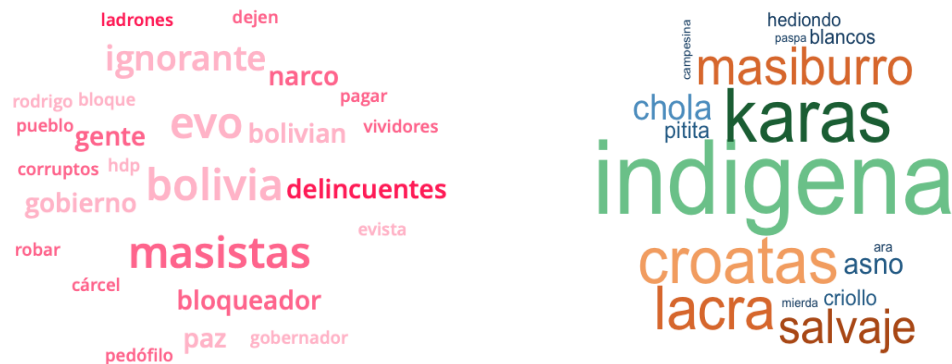
Gráfico 3: Nube de palabras de mayor frecuencia durante el Monitoreo